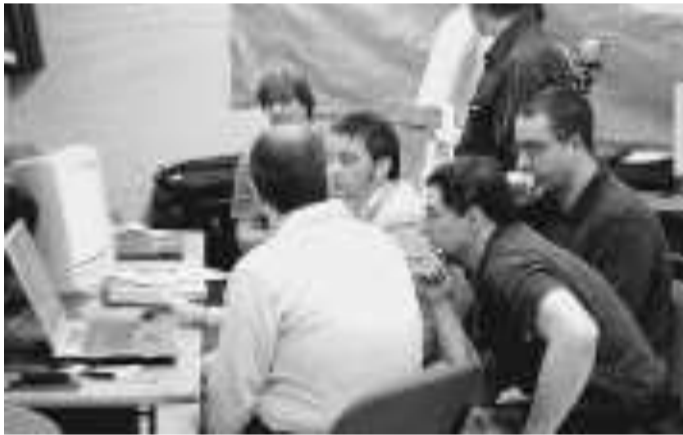
Il gruppo mantovano del Lug. In alto: il logo di Memobyte

Ma attorno al software libero è nato anche un movimento. Dedicato alla divulgazione di tutto quello che la libera circolazione di programmi consente: l'alfabetizzazione informatica di chi non potrebbe permettersi un computer, il risparmio ambientale ed economico determinato dalla